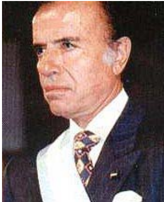
Carlos Saúl Menem

El principal problema que debió enfrentar fue la economía, arruinada por la hiperinflación y la recesión. Menem actuó con rapidez, introduciendo una serie de reformas de corte neoliberal: privatizó las empresas del Estado y los canales televisivos estatales. Desreguló la economía y estableció la libertad de precios.